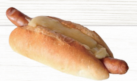
チーズドッグ Cheese hot dog 660円