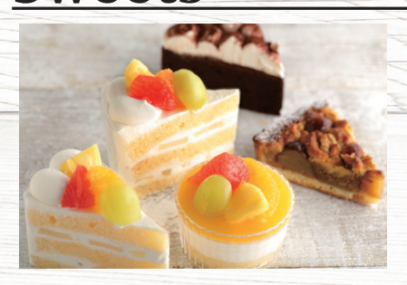
本日のケーキ Today's cakes コーヒーゼリー Coffee jelly