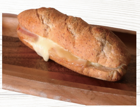
グラハムロール Graham roll 660円