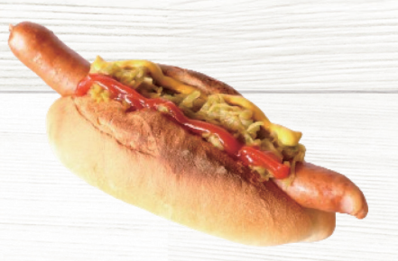
ヴィレッジ特製ドッグ Hot dog with curry-flavored cabbage 660円