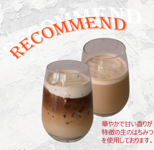
はちみつラテ (HOT/ICE) Honey latte 770円