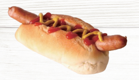
プレーンドッグ Hot dog 610円