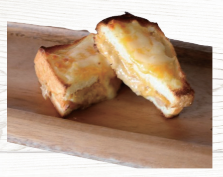
ツナチェダーサンド Tuna with cheddar cheese 550円