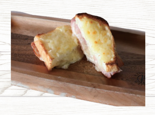
クロックムッシュ Croque Monsieur 550円