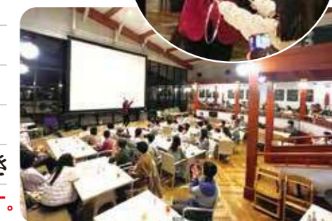
2023-24カウントダウン パーティー画像