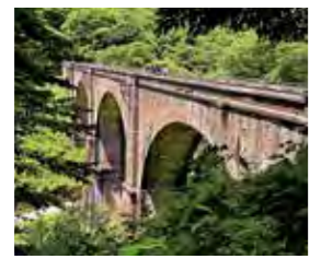
2023年6月撮影 碓氷峠第三橋梁

催行日 2023年9月13日(水) 行程 8:00出発 17:30到着予定 募集人員 30名(最少催行人員:20名) 参加費 8,000円(税込・昼食代含む) バス会社 草津観光自動車他 企画 株式会社中沢ヴィレッジ (群馬県知事登録旅行業2-476号) 添乗員有