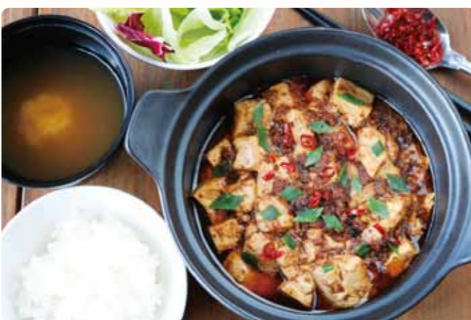
草津一田屋豆腐使用 うま辛 四川風麻婆豆腐 1,400円(税込)

群馬県産キャベツをふんだんに使用しお肉を包み込み、ブイヨンベースのトマトソースでコトコト煮込んだ逸品。キャベツの甘引き立つ優しい味わいながらコクを感じる一皿です。