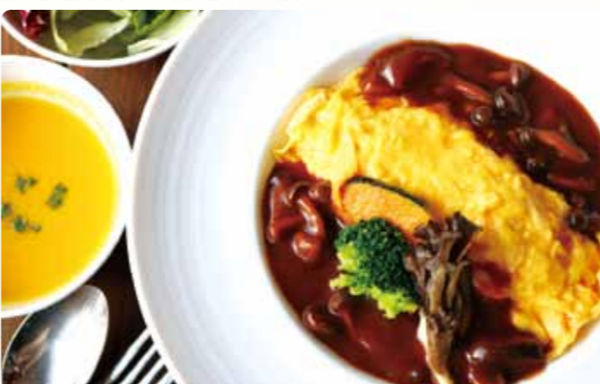
森の恵み 群馬県産きのこを使った デミグラスオムライス 1,400円(税込)

大きめのブロックで脂身の少ないロース肉を、低温調理でじっくり火入れをして柔らかく焼き上げた自家製のローストビーフです。温たまと絡めてお召上がりください。