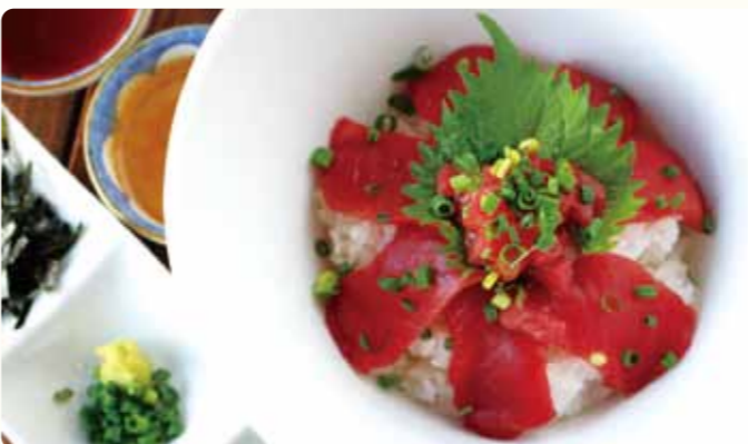
新鮮マグロのだし茶漬け膳 森の薫り 1,400円(税込)

ふわふわのオムレツに、群馬県やまこきこの産キノコと煮込んだデミグラスソースをかけて仕上げました。お子さまからご年配の方までお楽しみいただける優しい味です。