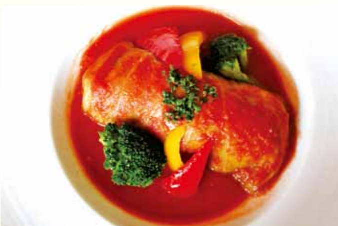
群馬県産キャベツのロールキャベツ トマトソース煮込み 1,400円(税込)

地元食材を使用した ヴィレッジオリジナルメニューをご用意しました。 お子さまに人気のオムライスや 冬の定番ロールキャベツも復活します。 冬の森を眺めながら、ゆったりとしたランチタイムをどうぞ。