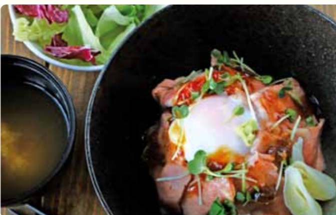
自家製ローストビーフ 群馬県産赤城鶏の温たまのせ 1,400円(税込)

大きめのブロックで脂身の少ないロース肉を、低温調理でじっくり火入れをして柔らかく焼き上げた自家製のローストビーフです。温たまと絡めてお召上がりください。